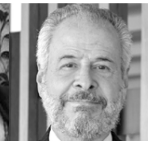
Embaixador André A. Corrêa do Lago (Secretário de Clima, Energia e Meio Ambiente do Ministério de Relações Exteriores)